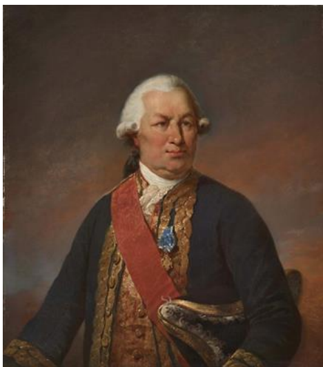
L'amiral-comte de Grasse ; peinture de 1843 par Jean- Baptiste Mauzaisse ; Musée du Château de Versailles